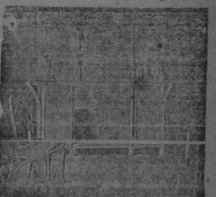
Teléfono No. 318

ha sabido demostrar que la fabricación de muebles es un arte artístico y delicado. 20—Apartado No. 269